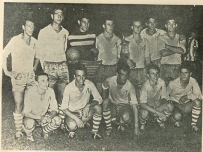
РЕПУБЛИКАНСКИ ПЪРВЕНЦИ за 1960 година: юношеският (горе) и детският (долу) отбори на Левски (София)